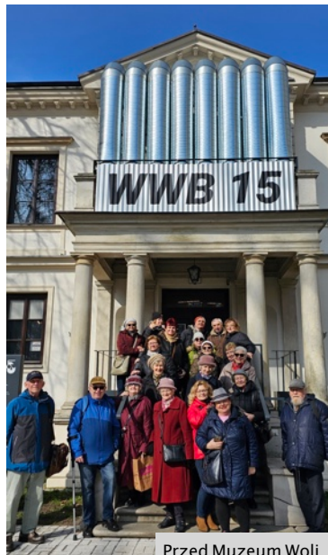
Przed Muzeum Woli.

Muzeum Woli mieszczące się w neorenesansowym pałacyku przy ul. Srebrnej 12 to kolejny przystanek naszej akcji. Malowniczy budynek odkrywa przed swoimi gośćmi pamięć o barwnych wydarzeniach warszawskiej dzielnicy. To miejsce - jak mówią sami pracownicy - gdzie historia Warszawy łączy się ze współczesnością i jej wyzwaniem. Mieliliśmy przyjemność